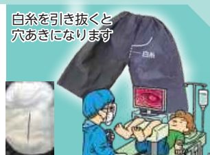
白糸を引き抜くと穴あきになります

素材が透けないので恥ずかしくなく大腸カメラ検査が受けられます。内側に吸水防護体のおむつを装填しているので匂いや汚れが減り、検査医は検査や手術に専念できます。検査室汚染対策になり、清拭する介助者の負担も軽減します。生理中でも検査を延期せず受けられます。前処置不安のある患者さんにも有用な単回使用穴あきパンツです。